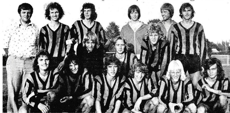
LANDSMESTER 1975 - YNGLINGE - NORDALS BOLDKLUB