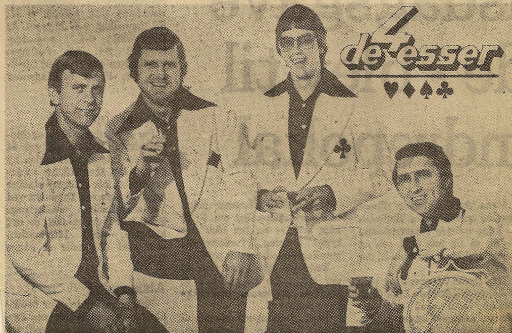
De fire Esser er et af de mange orkestre, der medvirker ved Fest-i-by. Orkestret spiller til ballet lørdag aften.

Der er også masser af sport i hele ugen. Der spilles fodbold med hold i alle aldre. Fredag er der som vanligt Handelsbank Cup for forretnings- og firmahold. I løbet af eftermiddagen er der også opvisning ved et springhold fra Sønderborg.