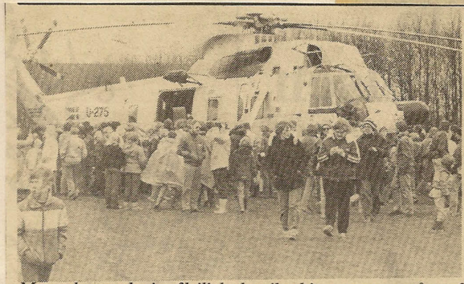
Mange benyttede sig af lejligheden til at kigge nærmere på en af luftvåbnets store helikoptere, der var landet på stadion i Nordborg efter opvisningen ved søen.

Men også demonstrationen af flyvevåbnets redningshelikopter bliver sikkert et trækplaster. Demonstrationen foregår — under forudsætning af, at vejret er til det, og at helikopteren ikke er med i en redningsopgave — over Nordborg Sø, og man vil bl.a. få at se, hvordan en nødstedt kan samles op fra vandet. Hele demonstrationen, der varer cirka en halv time, vil blive kommenteret over højttaleranlæg.