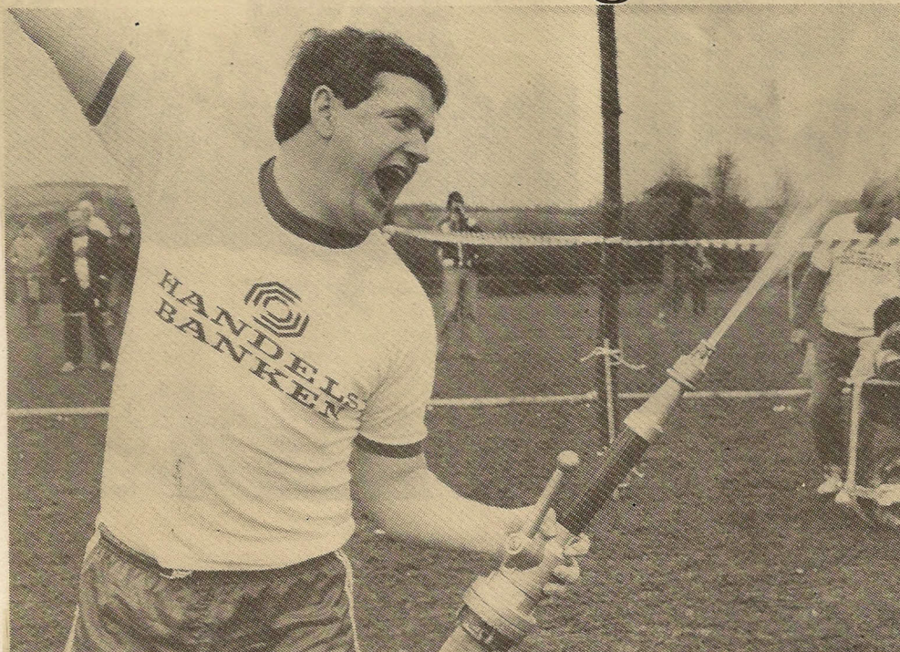
Størst jubel vakte den store opvisning, som de to brandværn havde sørget for. Det blev til en »strålende« opvisning med alle former for skum, skæg og ballade, og publikum fik sig mange billige grin i den anledning.