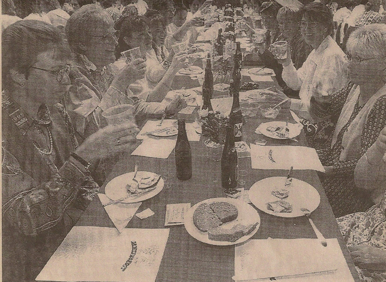
Både borde, hatte og festdeltagere var godt pyntede, da de nordalsiske kvinder mødtes til damefrokost.