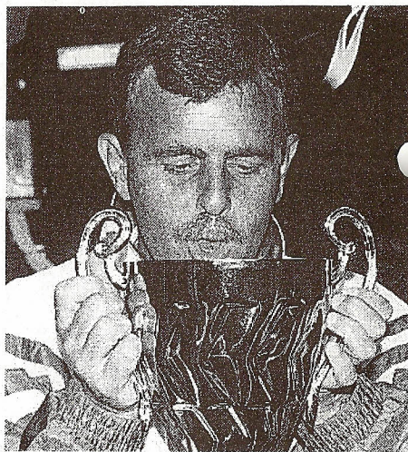
Det er skønt at være NB'er!

Vi havde set hvor god modstanderen var, så vi blev enige om at give alt hvad vi havde i os og vi ville kæmpe med det hvide ud af øjene. Vi ville ikke tabe ansigt og blive spillet ud af banen. Det skal lige siges, at portugiserne spiller i en række der svarer til toppen af den danske jyllandsserie.