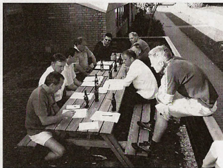
Et "varmt" emne blev behandlet af bestyrelsen denne varme aften.

Hvilke konklusioner der blev truffet på mødet, vil SPORTEN meget gerne berette om i næste udgave.