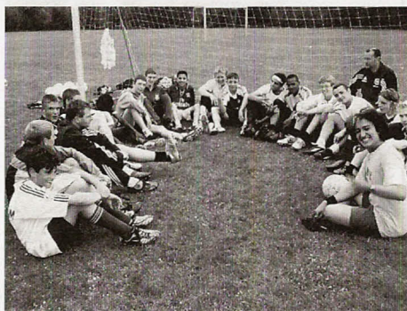
NB's juniorafdeling tog til Holland

Efter at puljekampene var færdig spillet, blev vi nummer 2 i vores pulje, og vi skulle spille søndag om pladserne 5 til 9, her var der 3 kampe.