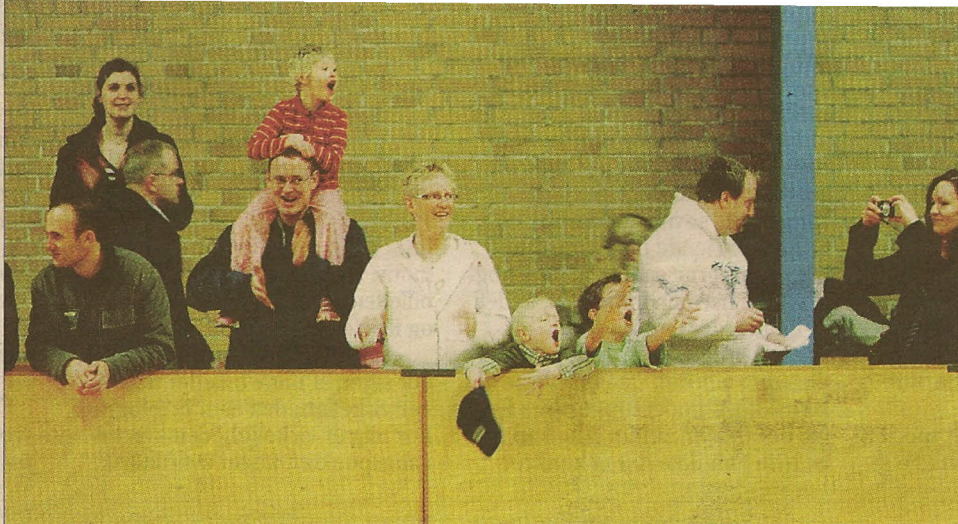
Mange forældre fulgte kampene i Nordals Idrætscenter, og der var jubel, når der blev scoret.

Tekst: Tage Christensen Tlf. 7342 5117, tac@jv.dk