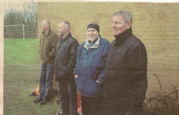
Et kig på tilskuerrækkerne.

Efter et tiltrængt bad gik alle i klubhuset for at nyde en velfortjent gang skipperlabskovs sammen med et »par enkelte øl«. Under 3. halvleg uddeltes præmierne til de glade vindere, og så var der ellers dømt almindelig hygge.