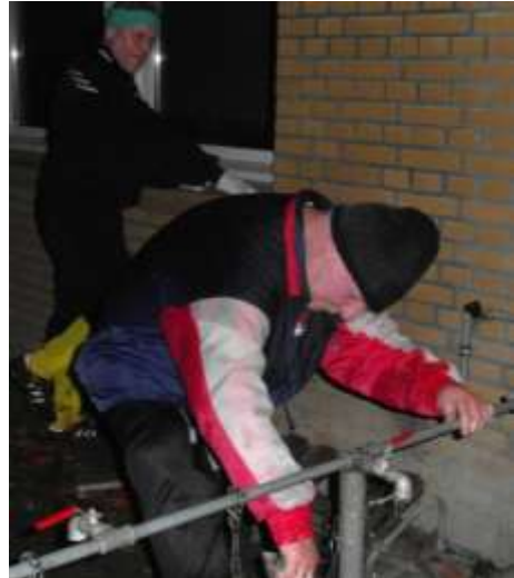
Aif har travlt med at rense fodboldstøvler