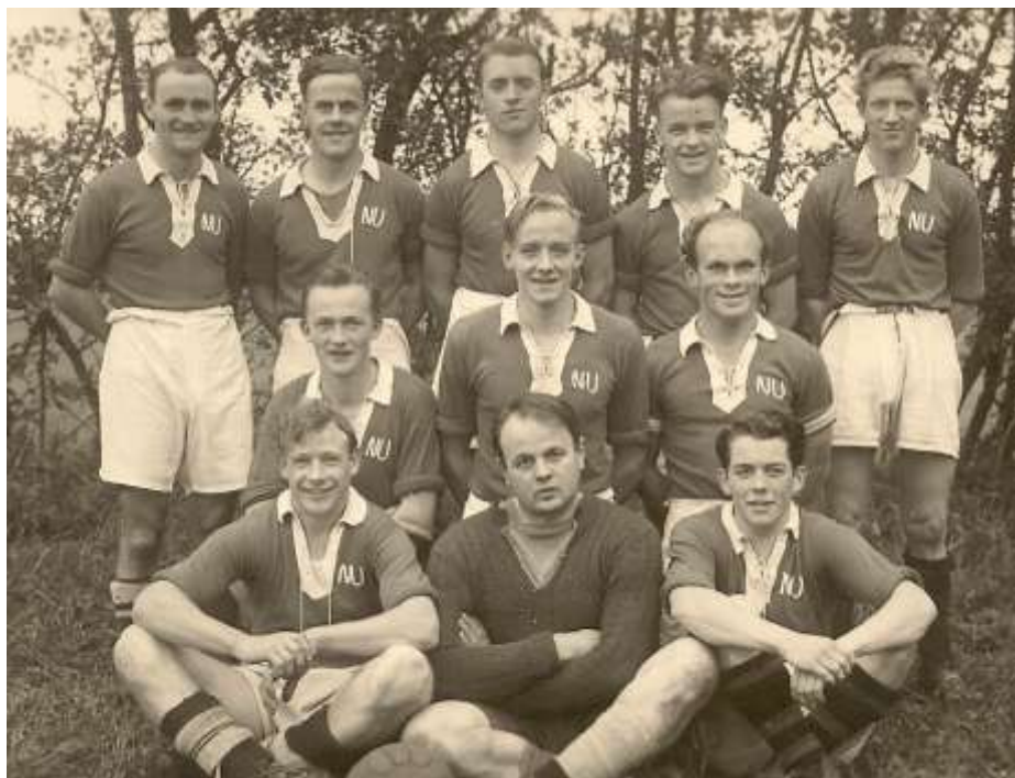
Nordborg Ungdomsforeningens herrehold 1949 (eller 1950)