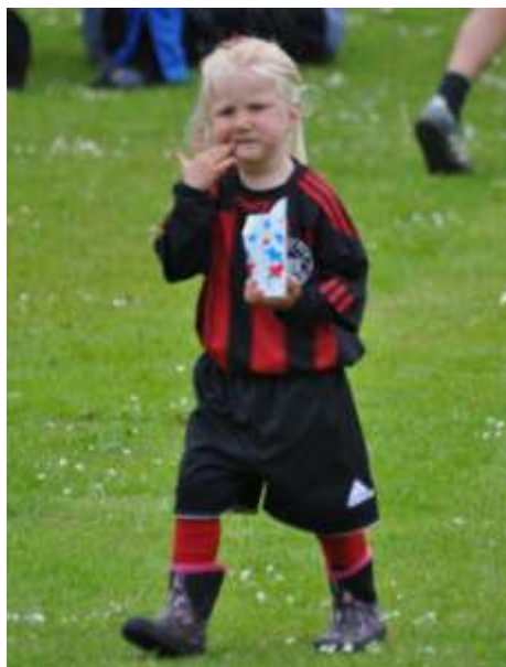
Jela for sig lidt popcorn ved NB dagen 2012