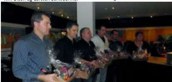
Tak fra spillerne til trænerne