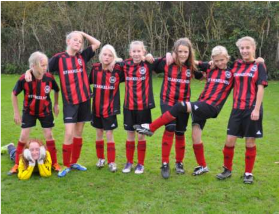
U12 pigerne før kampen mod Hørup d. 8. oktober