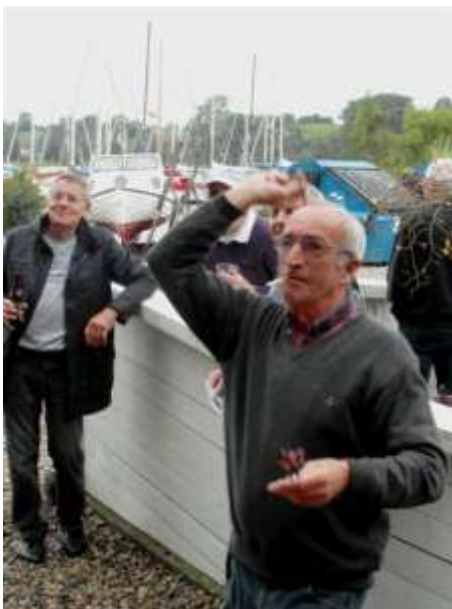
Havnechefen himself kaster pilen mod Dartskiven