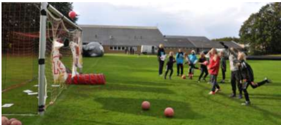
Pigeraketten var på besøg i Nordborg d. 19. september