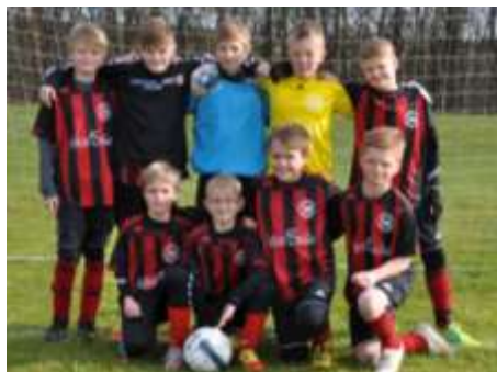
U11 drenge d. 14. april før kampen mod SUB Sønderborg

tag, vi i processen frem mod 2017 iværksætter. Vi vil gøre ord til handling og dermed vise troværdighed. Rom blev ikke bygget på en dag, vi når heller ikke at sætte alle både i vandet på en gang. Derfor skal vi væbne os med tålmodighed og se positivt på de små som store tiltag, der stille og roligt vil blive indført med tiden.