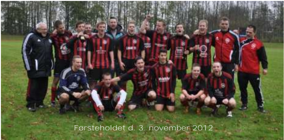
Førsteholdet d. 3. november 2012