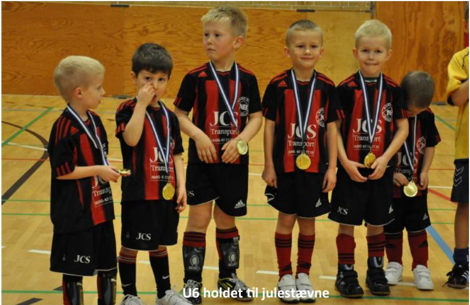
U6 holdet til julestævne

Brug bolden fornuftigt. Bliv medlem af 3F Als i Guderup. Vi hjælper dig over målstregen.