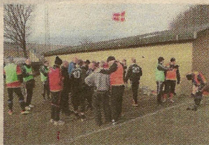
En forfriskning - det skal der til.